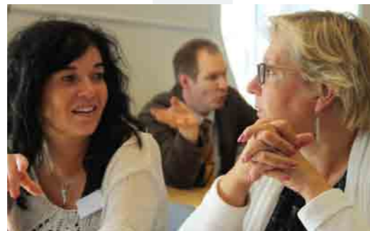
Opettajan työn siirtyminen digiaikaan on puhuttanut myös SKO:n valtuuskuntaa.

Töytärin väitöskirjan tulokset tuovat esiin ammattikorkeakoulujen opettajien työn laaja-alaisuuden, on olemassa individualistista ja kollegiaalista opettajuutta yhtä lailla kuin tiimimäistä ja yhteisöllistä opettajuutta ja opettajuutta oman alan toimijoiden kanssa. Näiden lisäksi