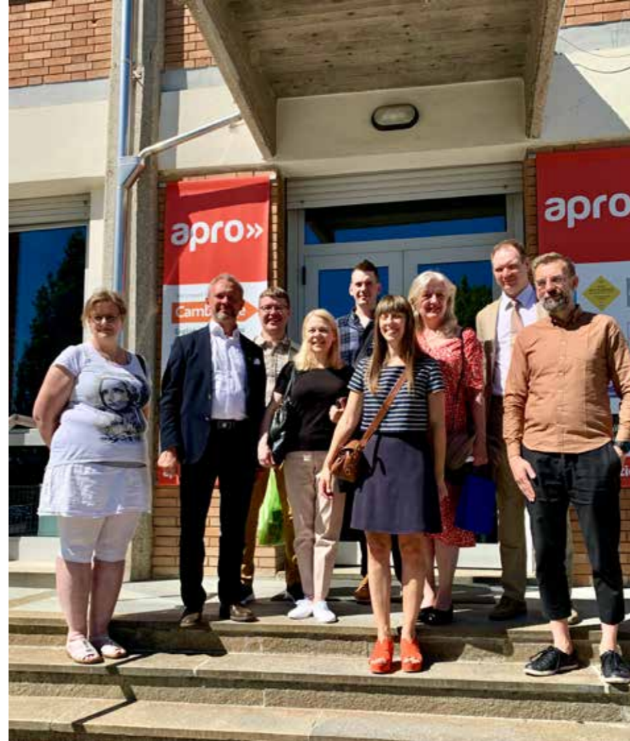
SKO:n hallitus vierailemassa Apro Tech -oppilaitoksessa (yllä).

Yhteistyökumppaneiden jälleennäkeminen: Konsta Ojanen ja kollega (alla).