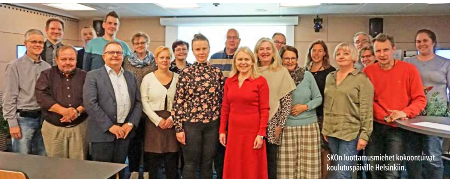
SKO:n luottamusmiehet kokoontuivat koulutuspäiville Helsinkiin.