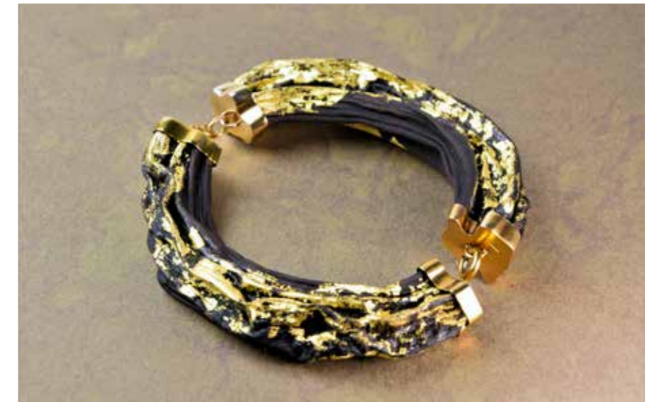
KaranBa-rannekoru, joka on tehty banaanista, lehtikullasta ja kullatusta hopeasta.

Tampereelle Kara päätyi tämän työn päätyttyä. Nyt hän työskentelee kahdessa pisteessä, Lempäälässä ja Tampereen Hervannassa. Hän on hyvin tyytyväinen työhönsä ja kokee olevansa oikealla alalla.